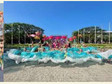
永康復興國小 荷花龍